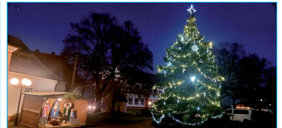
Vánoční strom s betlémem.