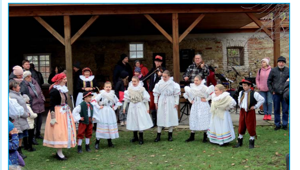
Vystoupení skřivanů z DDM Sluničko.