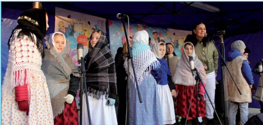
Kulturní pásmo žáků ZŠ.