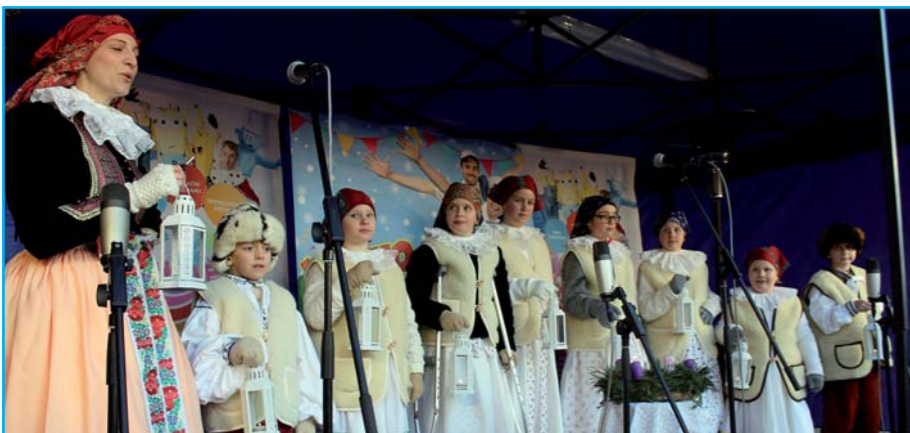
Skřivani z DDM Sluničko.