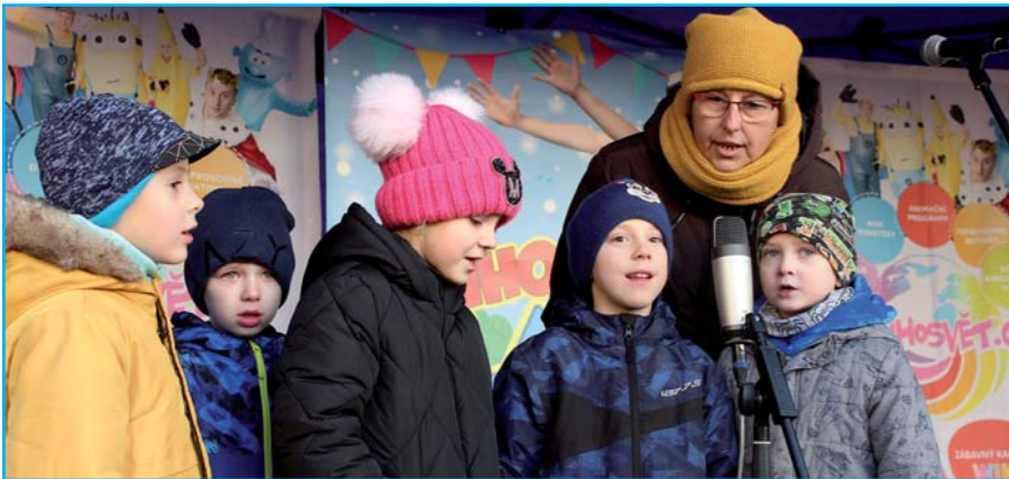
Vystoupení dětí z MŠ.