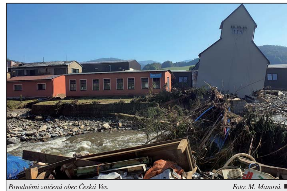
Povodněmi zničená obec Česká Ves.