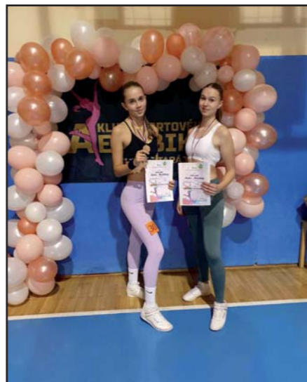
Aerobik nás baví.