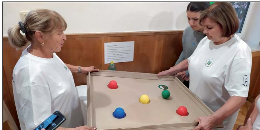
U jedné ze soutěží.