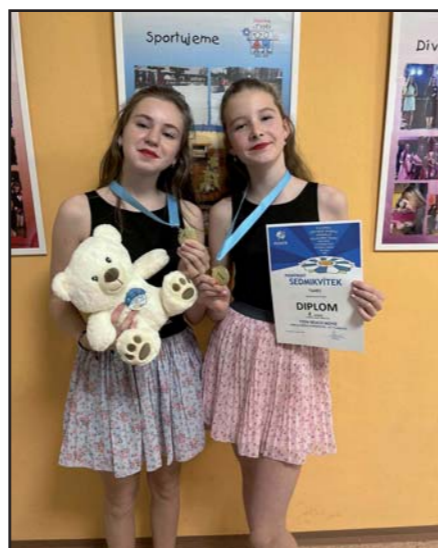
Aerobik nás baví.