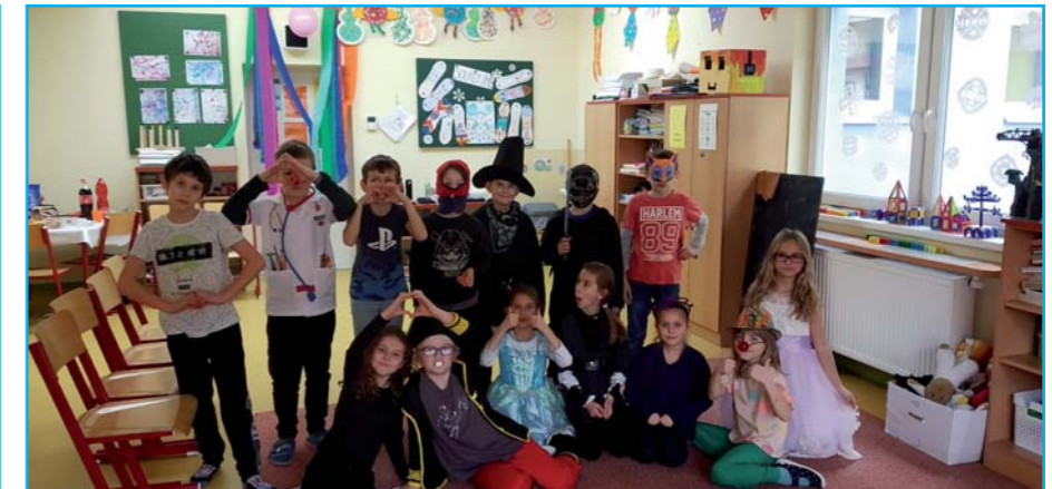
Karnevalové veselí.

Čas veselého maskárního reje uplynul jako voda, po dobrotách se jen zaprášilo. Nezbylo než se rozloučit a těšit se na další karneval zase za rok. Za ŠD Lenka Bílková