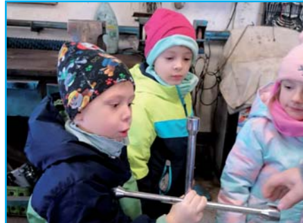
Návštěva autoservisu p. Řediny.

Na základě našeho třídního vzdělávacího programu a tématu, které bylo zaměřeno na profese kolem nás, jsme se ve středu 14. února vypravili s dětmi na exkurzi do nedaleké-