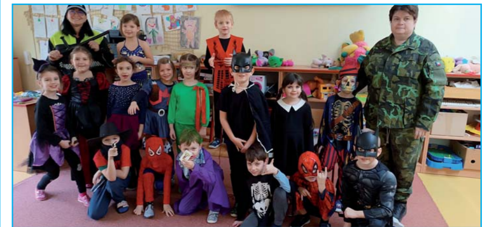
Karnevalové veselí.