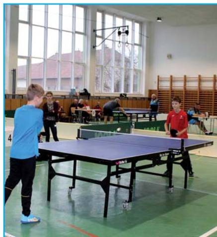
Turnaj ve stolním tenisu patřil mladým.

Těšíme se na setkání příští rok, přesněji 11. ledna 2025, kdy vás všechny opět očekáváme v Tlumačově na XII. ročníku turnaje ve stolním tenise.