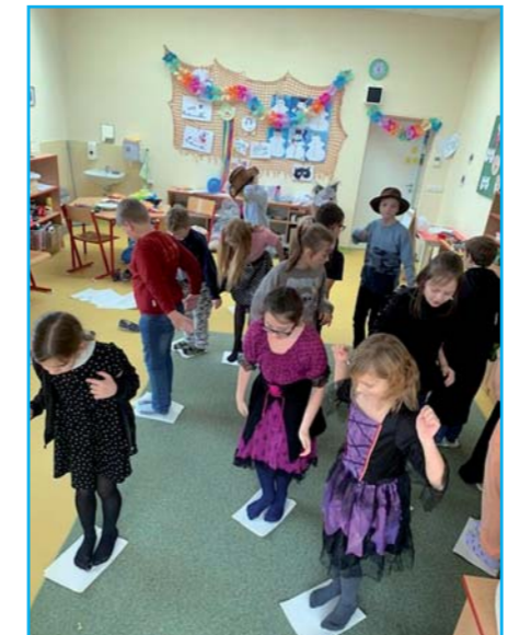
Karnevalové veselí.