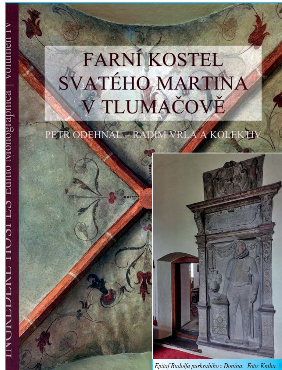
Epitaf Rudolfa purkrabího z Donína.