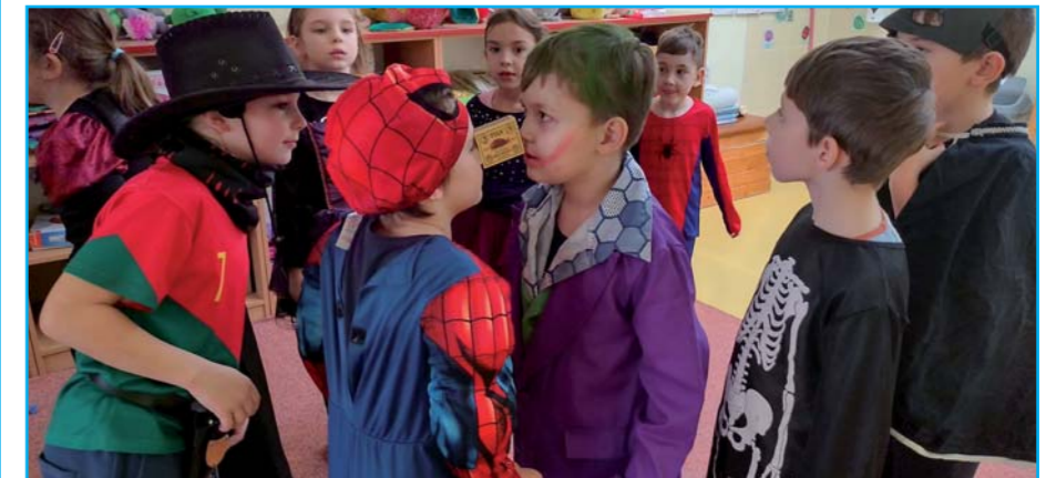
Karnevalové veselí.