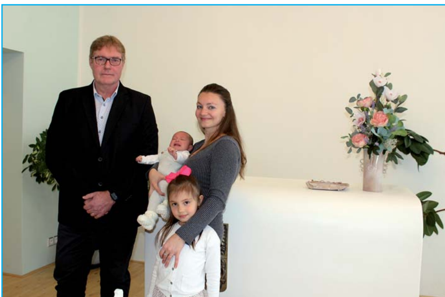
Starosta obce na vítání občánků.