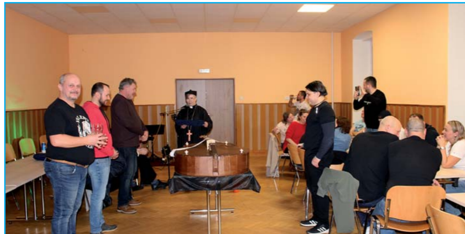
Pochovávání basy.