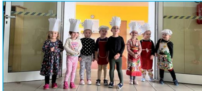
Malí kuchaři.

ho autoservisu pana Řediny. Bylo nám umožněno nahlédnout do dílen, prohlédnout si nářadí, které se používá při opravě automobilů, a sledovat práci automechaniků. Všechno vyprávění i ukázky těchto prací děti vel-