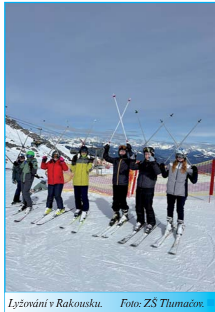
Lyžování v Rakousku.