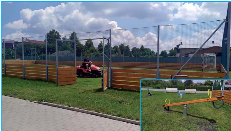
Hřiště už slouží dětem.

Michal Veselský, vedoucí oddělení výstavby a majetku