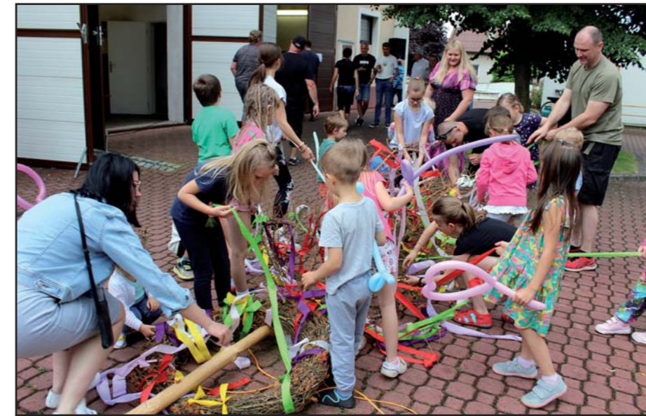
Nálež májky je vítaná trofej pro děti.

Před kácením se odehrál zábavný program s klaunem Pepino Prckem, který pobavil děti i dospělé. Skákací hrad a grilování klo-