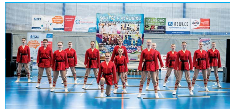
Věrnost, statečnost, rysost.