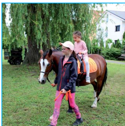
Děti na koních.