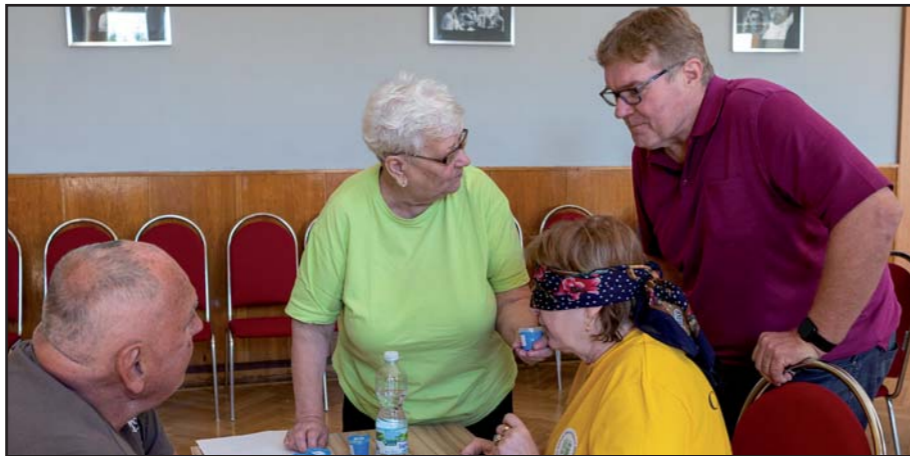
Olympiáda v Hulíně.