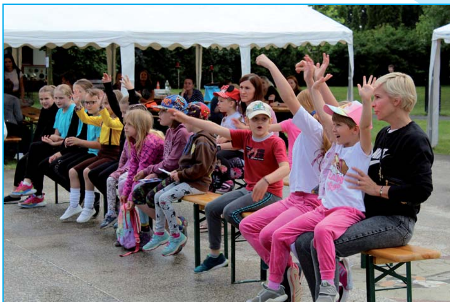
Odpoledne pro celou rodinu.