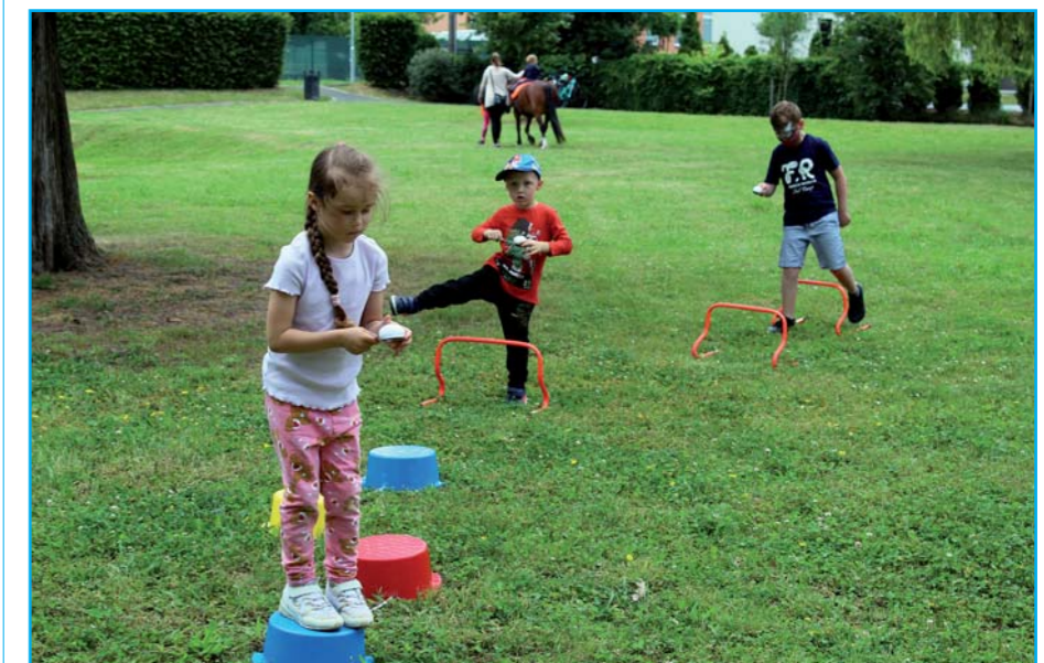
Odpoledne plné her.