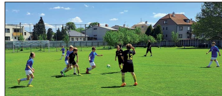
Fotbalový turnaj mládeže.

Pro rok 2024 můžete využít cyklobusy KOVED, které vás dovezou mimo jiné i na Bevlavu. Podrobněji se o nich dočtete na webu Integrované dopravy Zlínského kraje. Podrobně popsané trasy, výlety i odpočívadla najdete na webu bevlava.cz.