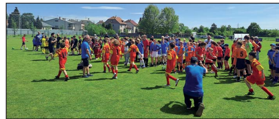
Fotbalový turnaj mládeže.