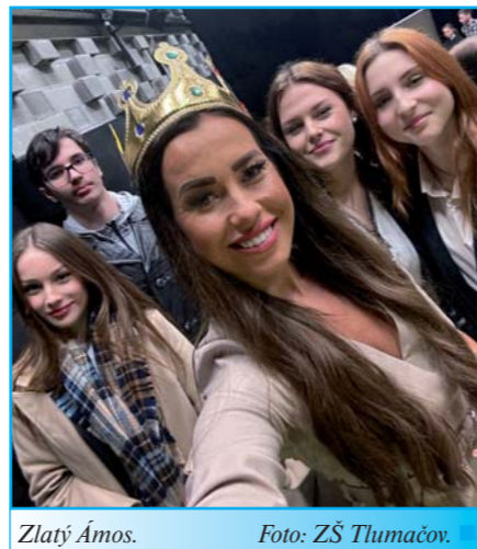
Zlatý Ámos.