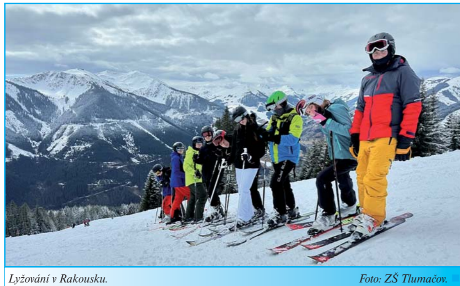
Lyžování v Rakousku.