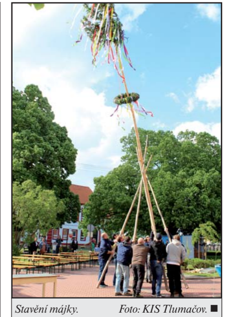
Stavění májky.

bás dodalo akci správnou atmosféru. Bečka piva zdarma od starosty obce a přenos hokejového zápasu na MS puštěný do „repráku“ udělaly ze sobotního odpoledne nezapomenutelný zážitek.