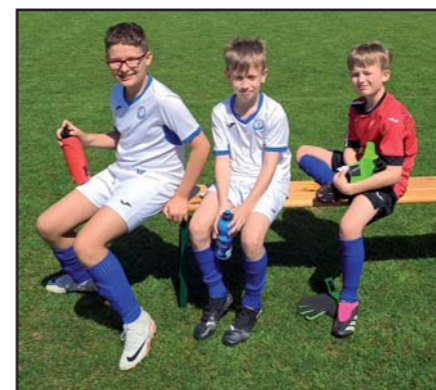
Fotbalový turnaj mládeže. ■

Mladí fotbalisté z Holešova a Morkovic zvítězili 1. května na mládežnickém turnaji v Tlumačově. Tlumačovská příprava obsadila 9. místo a mladší žáci se umístili na 2. místě. Deset týmů se utkalo v kategorii starší přípravky a čtyři týmy v kategorii mladších žáků. Akce se těšila velkému zájmu a účasti fanoušků a rodičů. zdroj inet