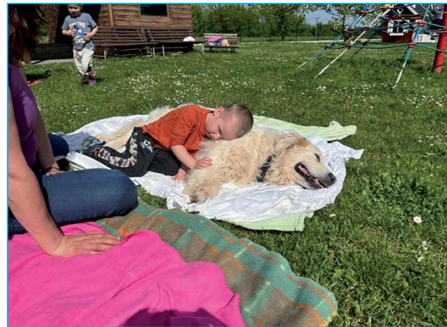
Pejsky máme rádi.

V úterý 16. dubna navštívili naši školku tři pejsci se svými cvičitelkami, aby dětem předvedli vše, co umí. Vzhledem k nepříznivému počasí probíhala canisterapie ve třídě naší školky. Už při prvním setkání a kontaktu s pejsky byly děti nadšené, pejsci přítulní, milí a mazliví, což si děti náležitě užívaly. Do programu byla zařazena překážková dráha s tunelem, kterou pejsci hravě zvládali. Potom si tuto trasu zkusily i samotné děti, které si na chvíli zahrály na své psi kamarády. Reagovaly na povel cvičitelky a všechny překážky, které se jim postavily do cesty, zvládly stejně dobře jako předtím jejich psi protějšky. Dále si děti vyzkoušely, jak umí pejsci poslouchat, naučily se jejich jména – Fanny, Oli a Jacky – a když pejsci na zavolání přiběhli k dětem, dostali pamlsky v podobě piškotu. Paní cvičitelka nám potom předvedla tanec s pejsky, procházení pejsků mezi nohama při chůzi a prozradila nám, jak se pejsci učí poslouchat a jak hravě zvládají povel „lehni, sedni, plaz se, zaštěkej, zatancuj, aport.“ Fenka Oli si potom zahrála s dětmi na schovávanou a vždy byla tak šikovná, že je ve všech skryších našla. Fanny a Jacky zase stahovali pytlíky s pamlsky z natažené šňůry na prádlo, nosili je dětem a za to dostali vždy nějakou drobnou dobrůtku. Na závěr programu