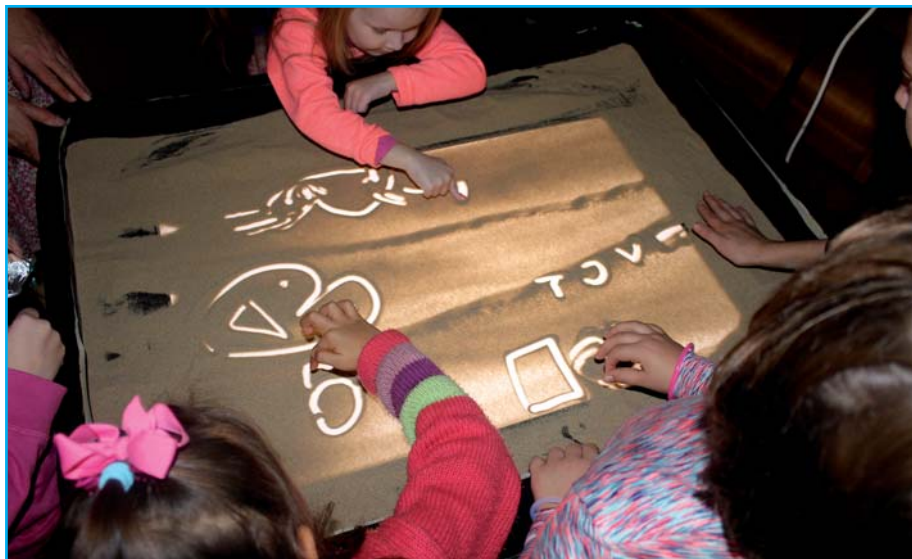
Malování do písku.