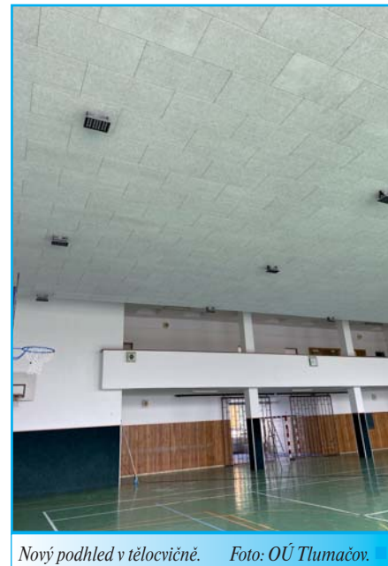
Nový podhled v tělocvičně.