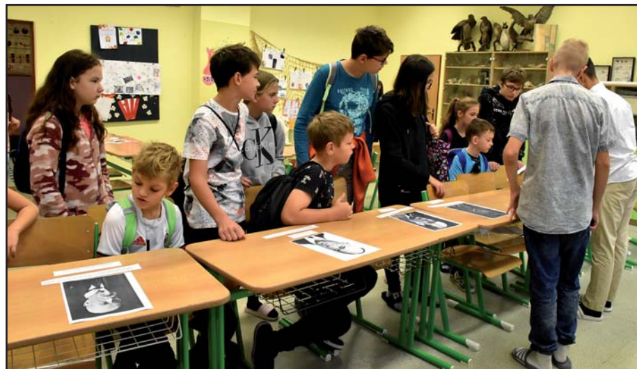
V duchu první republiky.