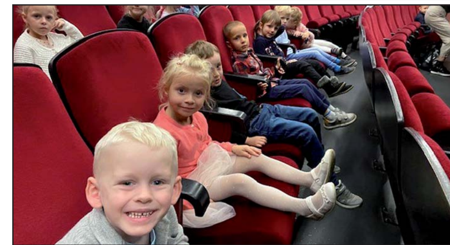
Děti v divadle.