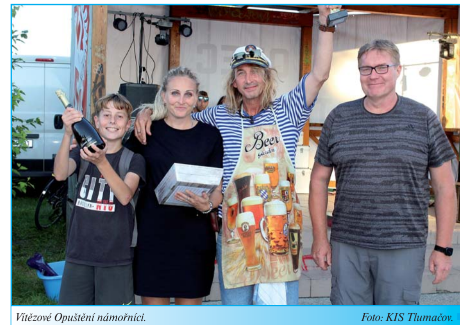
Vítězové Opuštění námořníci.