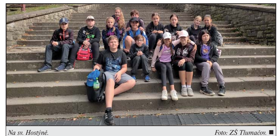
Na sv. Hostýně.