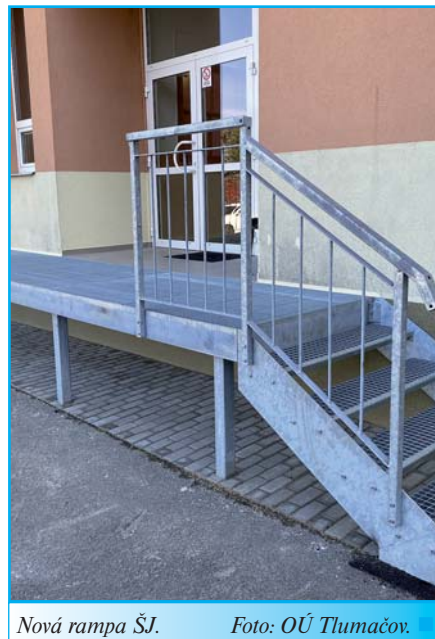
Nová rampa ŠJ.