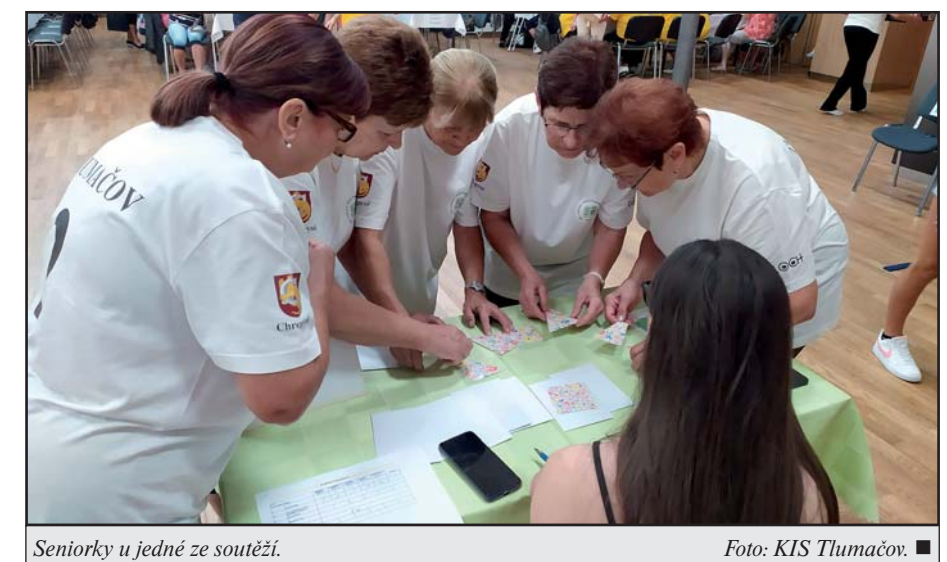
Seniorky u jedné ze soutěží.

Bludiště - cílem úkolu je najít cestu z bludiště, soutěží celé družstvo, měří se čas.