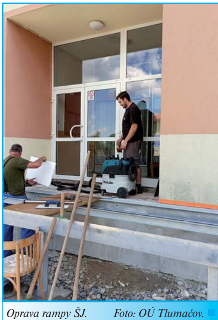
Oprava rampy ŠJ.

Michal Veselský, ved. odd. výstavby a majetku OÚ Tlumačov