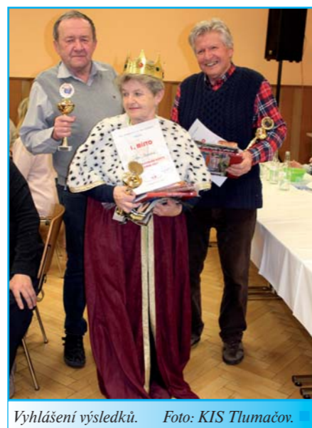
Vyhlášení výsledků.