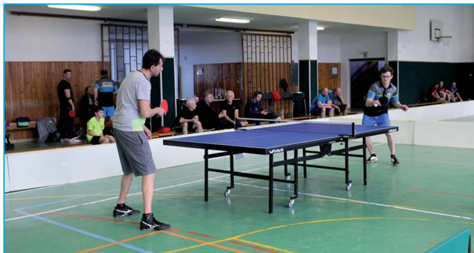
Turnaj v plném proudu.