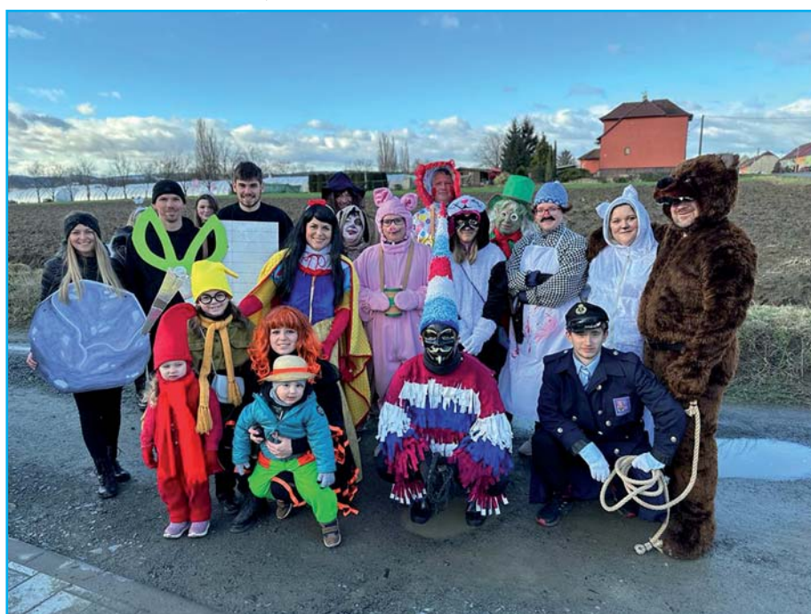
Masopustní rej masek.