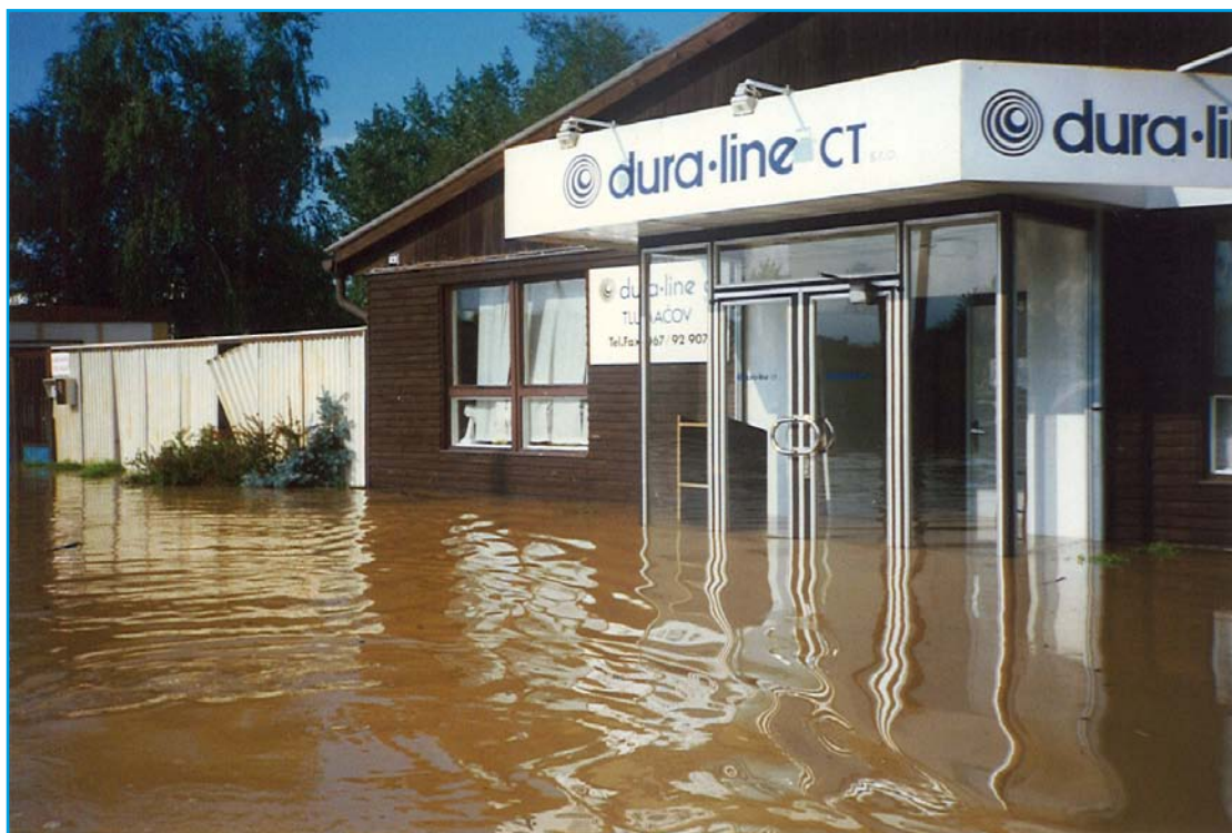
Firma Dura - Line postížena povodní v roce 1997.

2. Protipovodňová ochrana obce Tlumačov je i pro nás velmi potřebná. Zemský hřebčinec bez jakéhokoliv otálení souhlasil s uvolněním pozemků pro výstavbu hráze. Je třeba si uvědomit, že ztráty vzniklé povodní vysoce převyšují náklady na vybudování ochranných hrází. Komplikace, které způsobují někteří vlastníci je velmi sobecké.