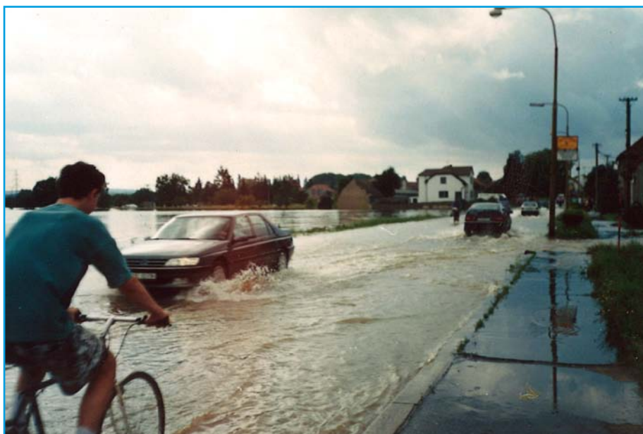
Cesta z Otrokovic, povodeň 1997.