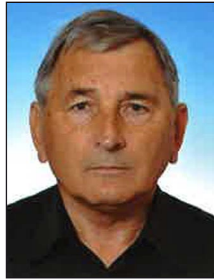
Krajský úřad Zlínského kraje odbor územního plánování a stavebního řádu