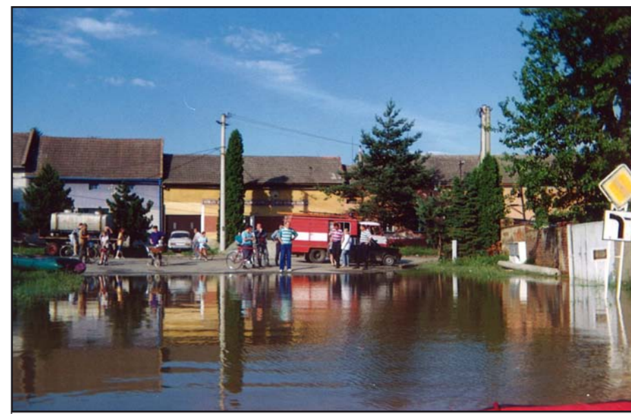
Cesta na Kvasice.

2. Přestože v poslední době nás více trápí sucho, takže povodňová ochrana naší obce mnoho lidí, zvláště v té části, která povodněmi netrpí, spíše nezajímá, si myslím, že ochrana proti povodním je potřebná. Protože nejsem stavitel ani ekonom, neodvažuji se vyjádřit k formě ochrany proti povodni. Měla by však být 100% funkční, pro obec ekonomicky únosná a měla by i „zapadnout“ do krajiny kolem Tlumačova. To, že negativně nepostihne vlastníky pozemků, ani nedá možnost s nimi „čachrovat“, považuji za samozřejmé.