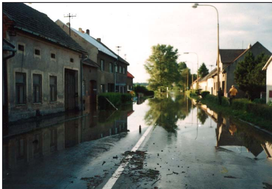
Cesta na Hulín při povodni 1997.

2. Jaké je Vaše stanovisko, názor k problematice povodňové ochrany obce Tlumačov?