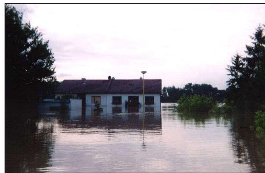
Tlumačovská tůňka v roce 1997.