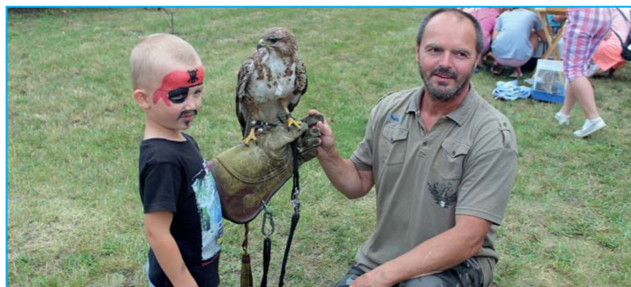
Odpoledne pro celou rodinu.