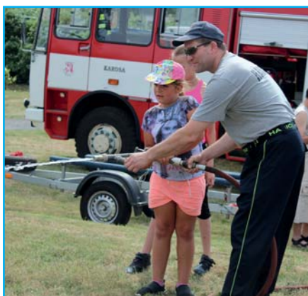
Odpoledne pro celou rodinu.