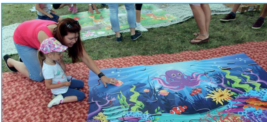
Odpoledne pro celou rodinu.