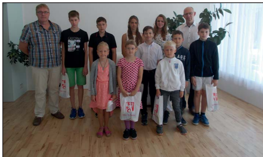
Ocenění žáci ve školním roce 2017/2018.