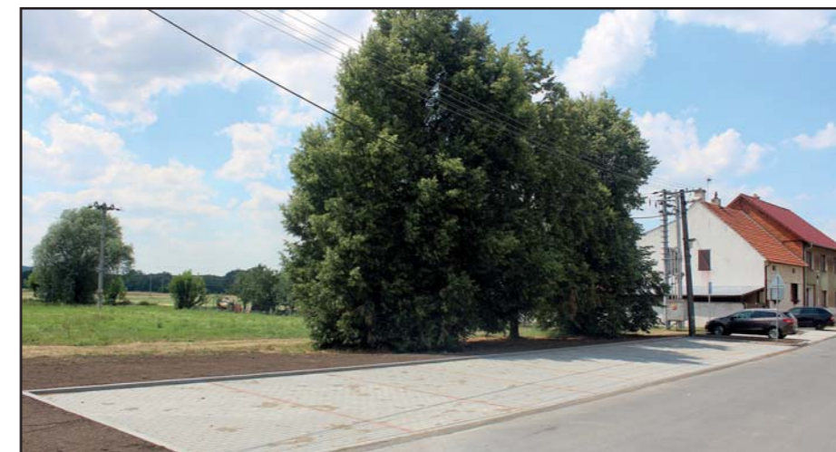
Parkoviště vylepší dopravní situaci v ulici.