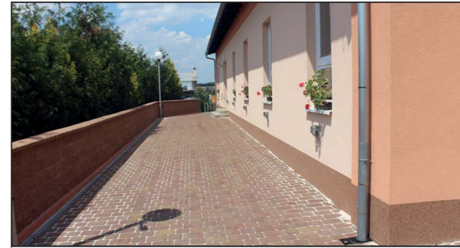
Další investice do Klubu obce na Zábrani.

Pozn. Na webových stránkách obce, přejděte na adresu: http://www.tlumacov.cz/kis/kis-pronajem-cementarna.php naleznete aktuální kalendář obsazenosti klubu.