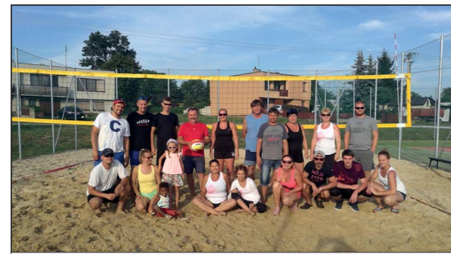
Turnaj v „plážáku“.