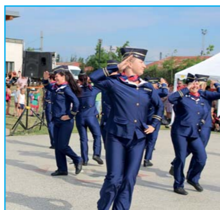
Odpoledne pro celou rodinu.