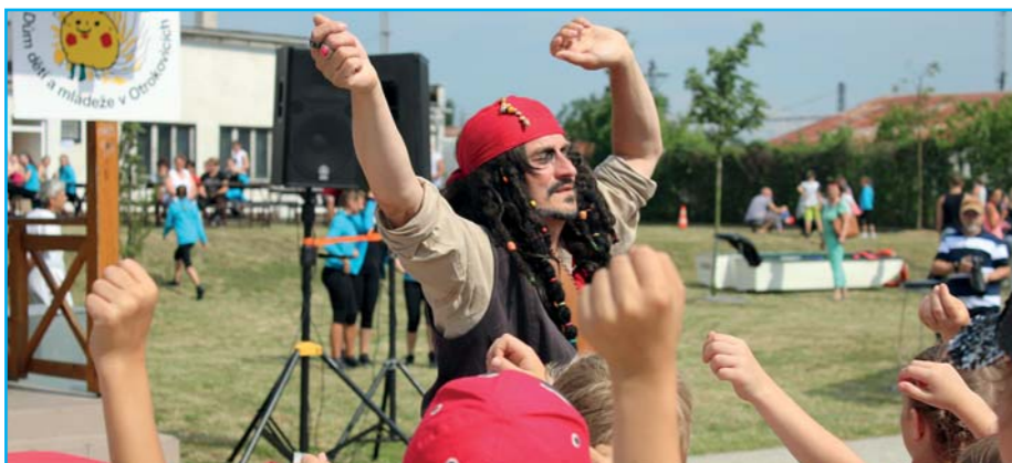
Odpoledne pro celou rodinu.