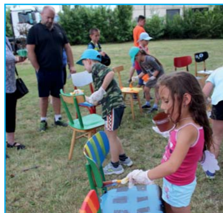
Odpoledne pro celou rodinu.