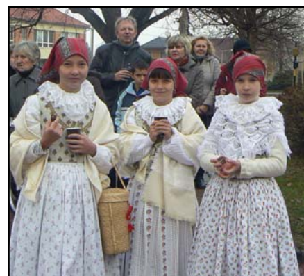
Tlumačovské holky. ■