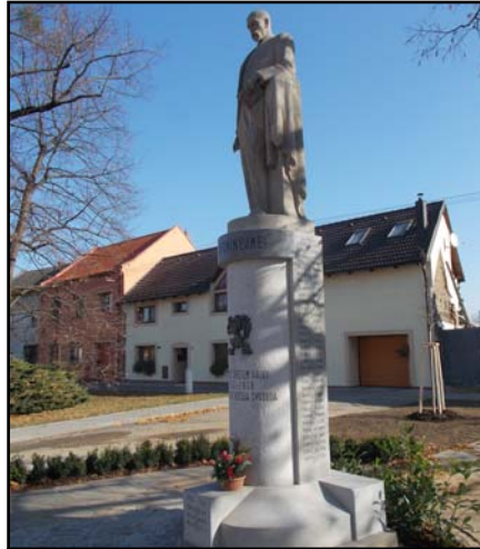
Pomník T. G. Masaryka. ■