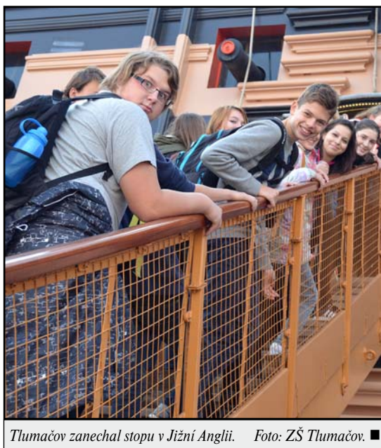
Tlumačov zanechal stopu v Jižní Anglii. ■

Středeční dopoledne strávili žáci opět výukou ve škole. Odpoledne jsme navštívili město Arundel, respektive stejnojmenný hrad. Monumentální stavba byla založena již v roce 1067 a v současné době je rodinným sídlem vévody z Norfolk, nejvýše postaveného šlechtice v Británii hned po čle-