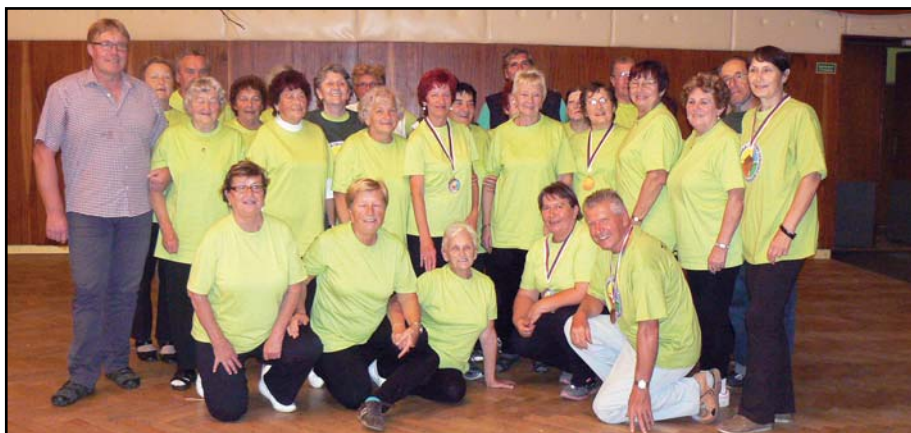
Tlumačovští senioři na Hrách seniorů v Chropyni.