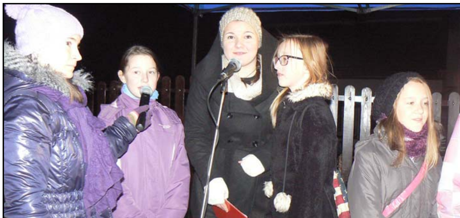
Vystoupení žáků ZŠ.