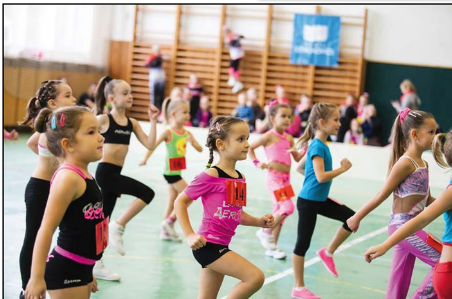
Soutěž v aerobiku.