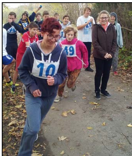
Atmosféra byla úžasná. ■

pozor na větve keřů a stromků, které rámovaly běžeckou dráhu. Téměř všichni se s terémem poprali velmi dobře, ale bohužel byli