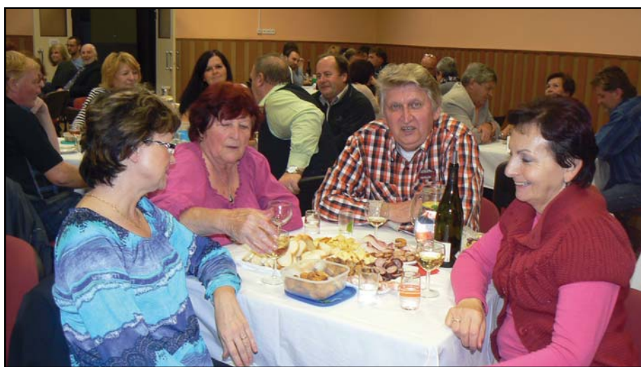
Posezení u vína a cimbalu.