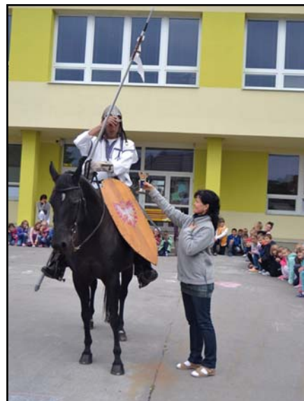
Sv. Václav v Tlumačově. ■