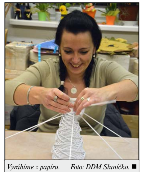
Vyrábíme z papíru. ■

tvoření, malování na obličej, kruhového tréninku, aerobiku, deskových her a spousty dalších aktivit. Proběhly také Vánoční dílny, s možností kreativního tvoření dekorací nebo malých dárečků k blížícím se zimním svátkům.