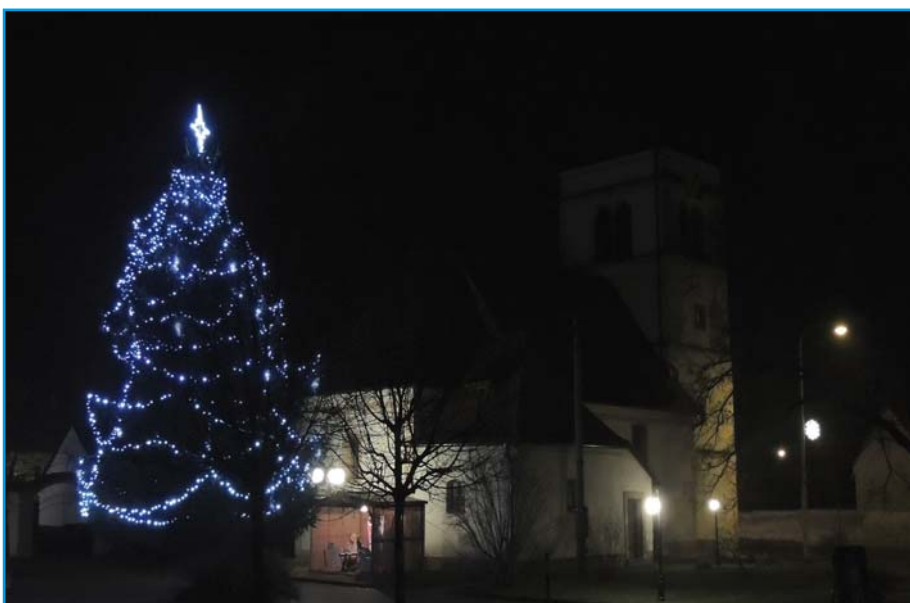
Tlumačovský vánoční strom s betlémem a kostelem v pozadí.