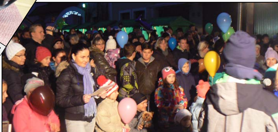
Rozsvícení vánočního stromu.

Práce uměleckých kovářů. ■