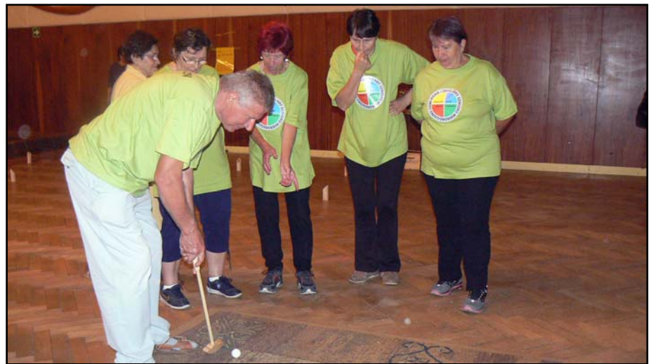
Tlumačovští senioři soutěží.