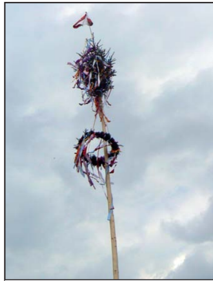
Tlumačovská májka. ■

Pro všechny byl přichystán bufet, kde bylo možné doplňovat tekutiny, i „něco na zub“ se