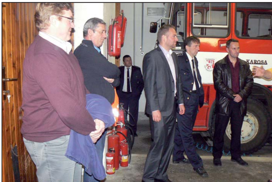
Návštěva z Ďanové v hasičské zbrojnici.

Nabídka výše zmiňovaných aktivit v Tlumačově je celoročně celkem pestrá, akce