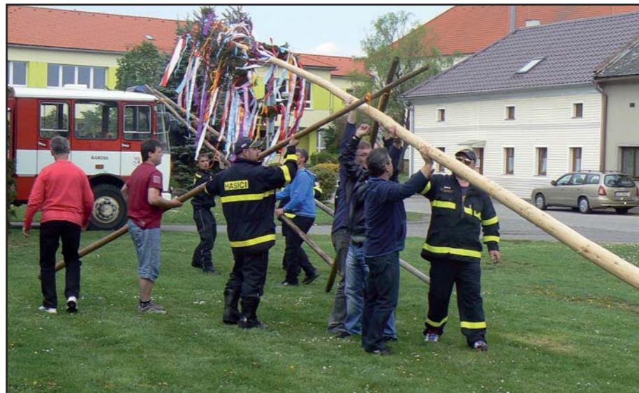
Stavění májky. ■