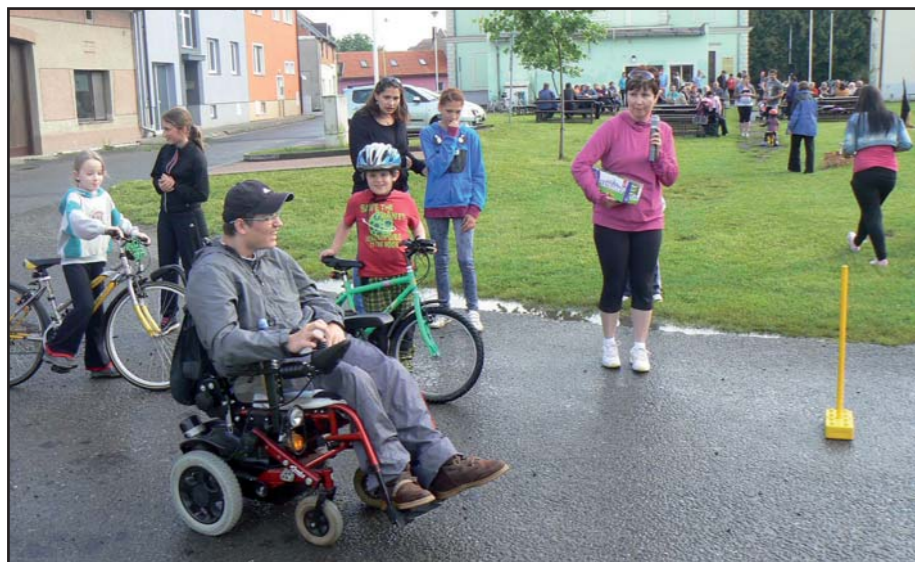
Soutěž ve slalomu. ■