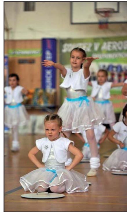
Sestava „Sněhová říše“.

Bc. Hana Hlobilová, vedoucí odloučeného pracoviště Tlumačov DDM Sluníčko