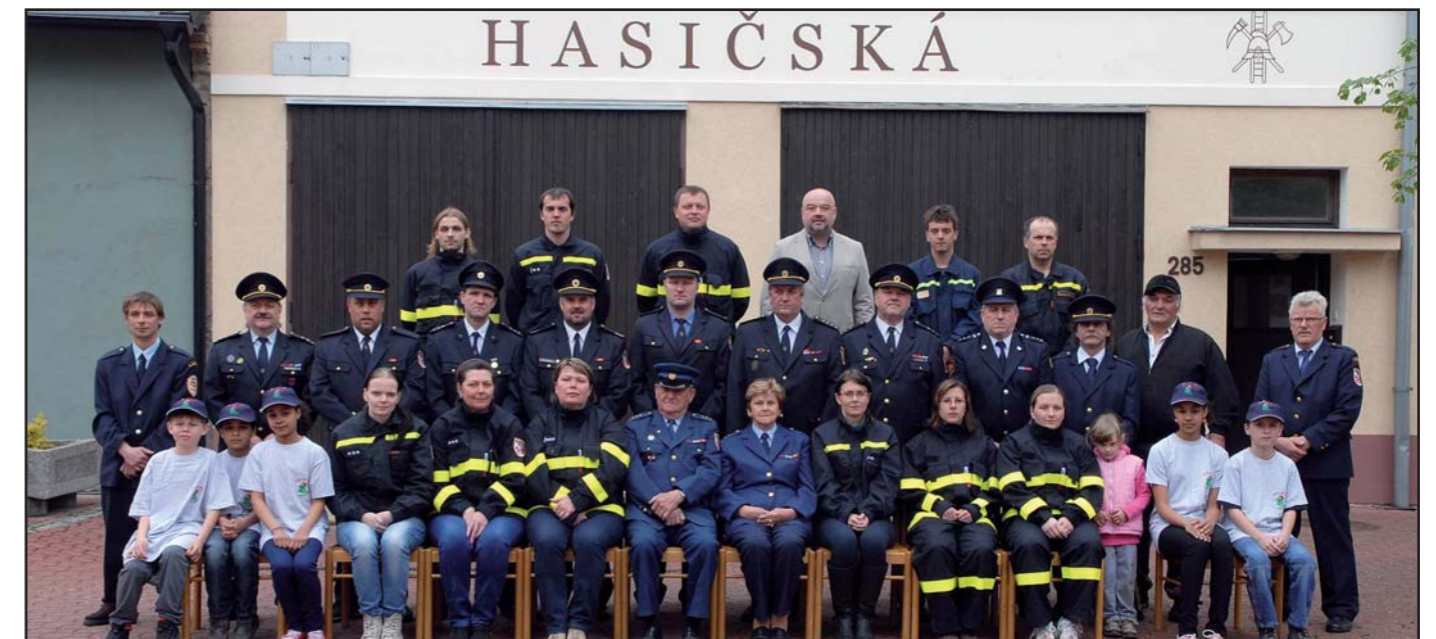
Tlumačovští hasiči slaví 130. výročí vzniku.