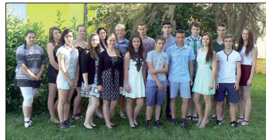
SEZNAM ŽÁKŮ IX. TRÍDY 2014/2015