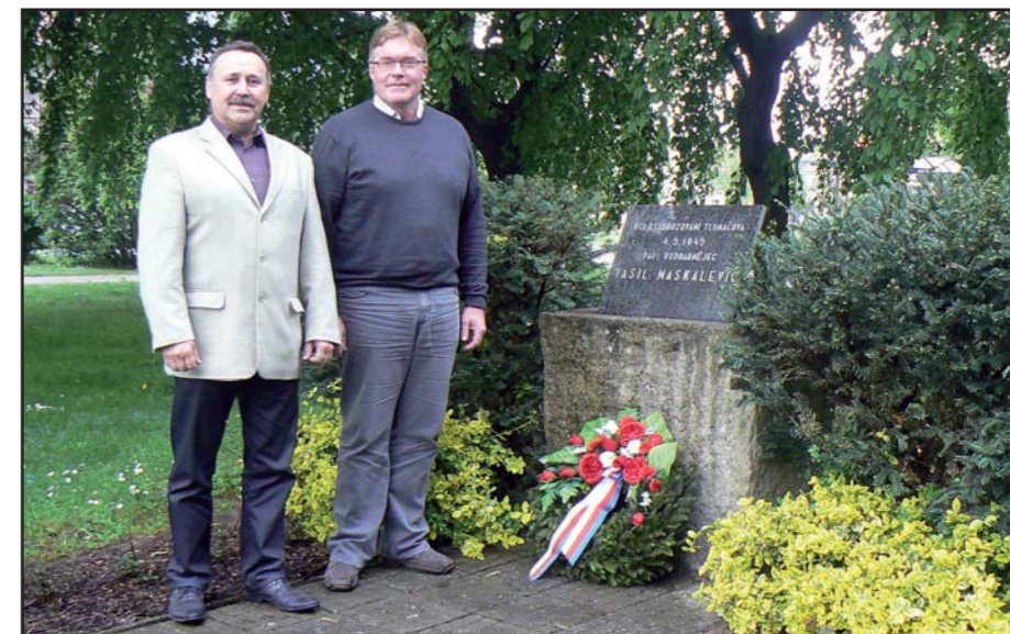
Vedení obce uctilo památku padlých za II. světové války.

V rubrice Společenská kronika jsou zveřejňovány významné životní události občanů Tlumačova. Pokud nechcete tyto informace, které se Vás osobně týkají zveřejnit, obraťte se na matriku osobně nebo telefonicky na tel. číslo 577 444 219