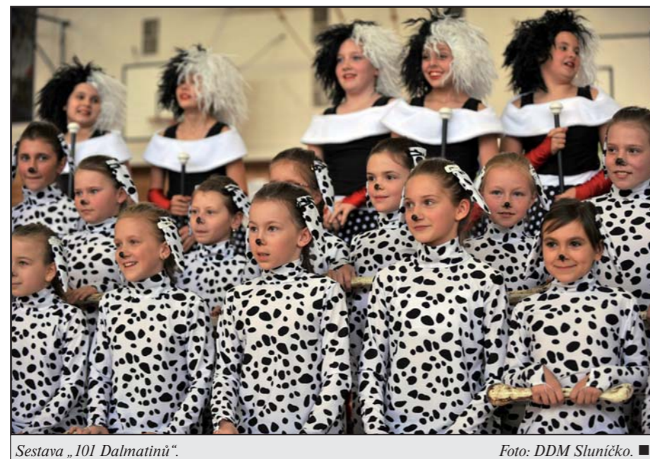
Sestava „101 Dalmatinů“.

Kategorie 14 a více let Estetická DDM Veselí nad Moravou - Kapky ohně Aerobik Coufalovi Olomouc - Dýchla na nás minulost