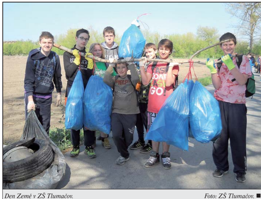
Den Země v ZŠ Tlumačov.