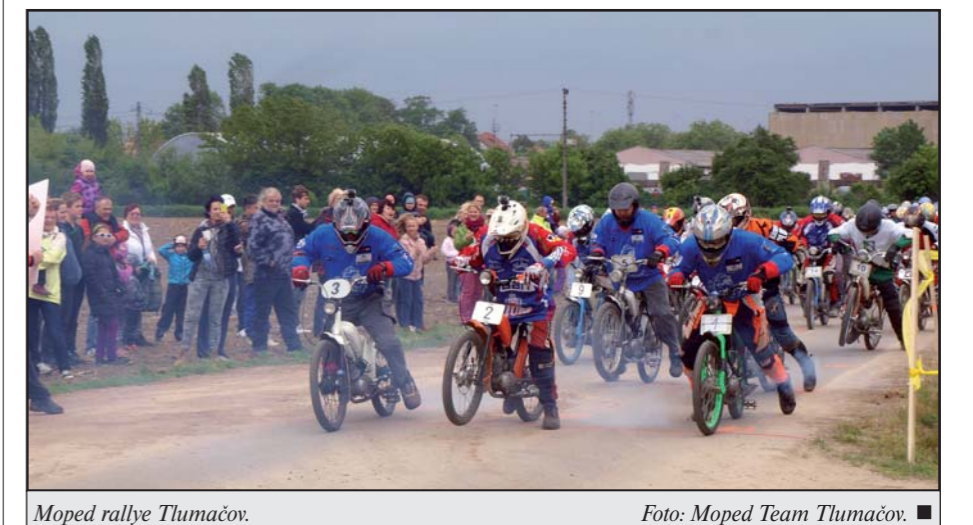
Moped rallye Tlumačov.