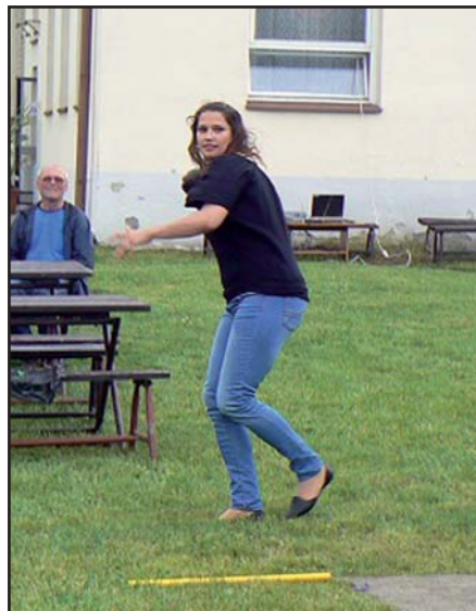
Soutěž hod kouli. ■

našlo. Většina přítomných si i opekla špekáček. Pro některé to byl vůbec „první letošní“. Renáta Nelešová, vedoucí KIS Tlumačov