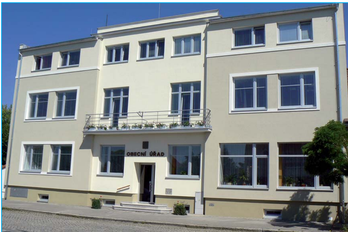
Budova OÚ po rekonstrukci.