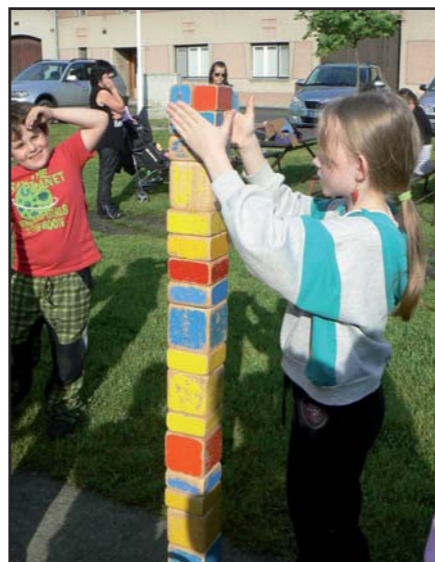
Stavění z kostek. ■