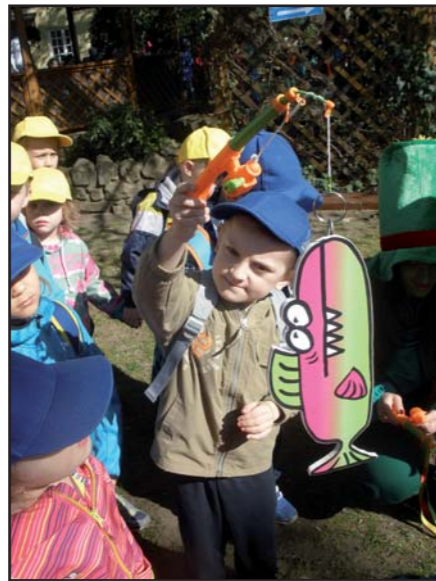
Děti ve Starém Městě.

zovala kožešiny lesních zvířátek, a děti měly za úkol je poznat. I tento úsek jsme všichni zvládli na výbornou a za odměnu jsme si mohli pohladit krásného černého králíka, který spokojeně chroupal ve svém pelišku sladkou, chutnou mrkvičku. Naše další za-