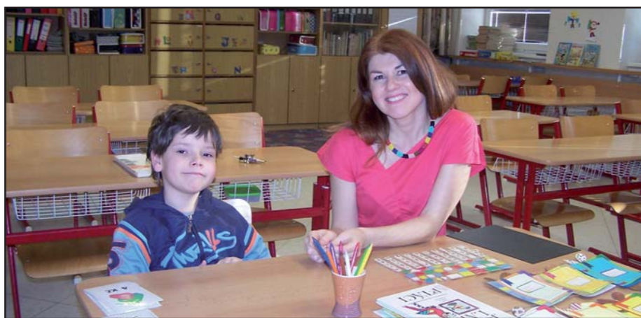
Zápis předškoláků do I. třídy.

Všechny děti u zápisu prokázaly, že již umí a znají spoustu věcí. Například správně držet tužku, vyslovovat všechny hlásky nebo se orientovat v základních geometrických tvarech. Ze svého prvního velkého dne si děti odnesly i několik drobností na památku. Doufáme, že se dětem u zápisu líbilo alespoň stejně jako nám. Na všechny šikovné předškoláky se pak těšíme v září. Mgr. Leona Jirušková