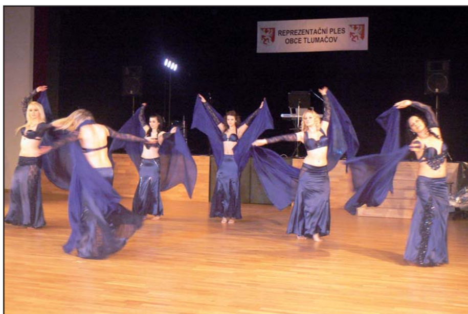
Předtančení skupiny Anifě.