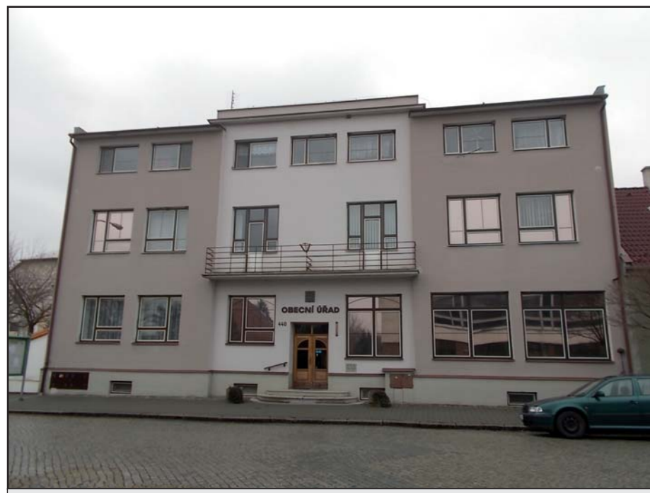
Budova obecního úřadu.