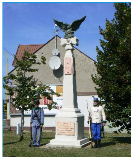
Památník Hrdinů 1866.