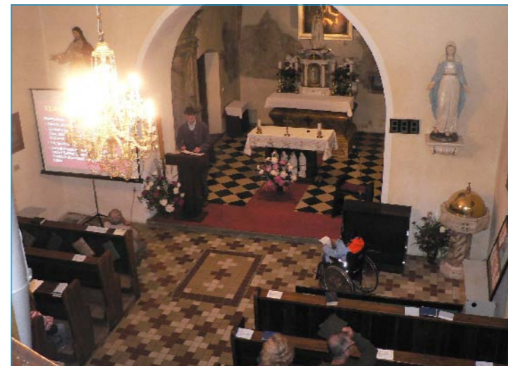
Tlumačovský kostel při „Noci kostelů“.

P. S. Pokud jste si zapomněli vzít upomínkovou pohlednici nebo malou brožurku, přijďte si je zdarma v y z v e d n o u t do KIS.