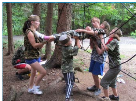
Na táboře bylo fajn.

Každý z nás někdy snil o tom dostat se alespoň na malou chvilku do minulosti, podívat se jak to dříve vypadalo nebo nahlédnout do budoucnosti a zjistit, co nás čeká. Taková možnost se podařila právě dětem z našeho tábora. A musím říct, stálo to za to. Podle dopisu, který byl doručen na Trnavu naší skupině táborníků od profesora Thomase Mondgomeryho Edstaina a jeho instrukcí, se nám podařila najít a sestavit „Brána času“. Ihned jsme branou všichni prošli, ale nic se nestalo. Mysleli jsme, že jsme ji špatně sestavili a už jsme tomu nevěnovali větší pozornost.