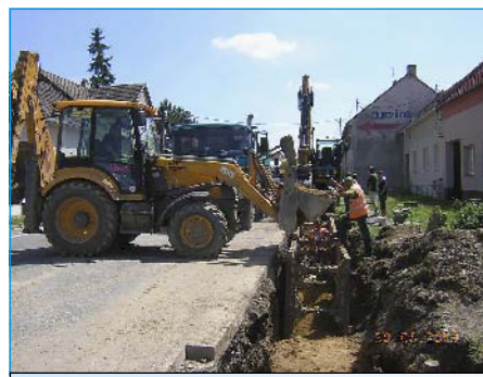
Odkanalizování obce Tlumačov v Masarykově ulici.

Součástí III. etapy odkanalizování obce Tlumačov bylo vybudování 4.660 m kanalizačních stok v severní části obce, které je složeno z rekonstruované a nové kanalizace o délce 3.271 m, upravené kanalizace formou vložkování o délce 429 m a dále výtlačného kanalizačního potrubí o délce 960 m. Nedílnou součástí bylo vybudování 3 čerpacích stanic splaškových vod v lokalitách ul. Masarykova, ul. Machovská a ul. Kvasická („U rybníčka“), včetně zpevněných ploch, oplocení a přípojek NN pro tyto čerpací stanice.