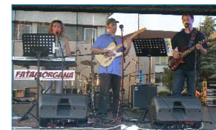
Vystoupení kapely Fatamorgána.