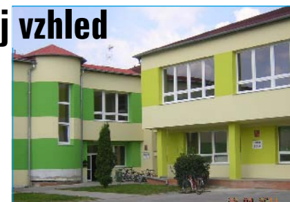
ZŠ Tlumačov v „novém kabátě“.

měnu starých oken a dveří za nové výplně, které budou splňovat energetická kritéria dnešní doby. Z tohoto důvodu také projekt nese název „Realizace úspor energie ZŠ Tlumačov“. Projekt je spolufinancován Evropskou unií, fondem soudržnosti a Státním fondem životního prostředí ČR v rámci Operačního programu životního prostředí. Dá se říci, že v tyto dny se podle harmonogramu rekonstrukce dostává do „cílové roviny“. Byla již provedena veškerá výměna výplní, tedy veškerá okna i dveře jsou vyměněny. Zateplení fasády probíhá na budově jídelny a následuje zateplení stropů všech budov. Fasáda má na mnohých místech již konečnou, barevnou podobu. Dílo realizuje