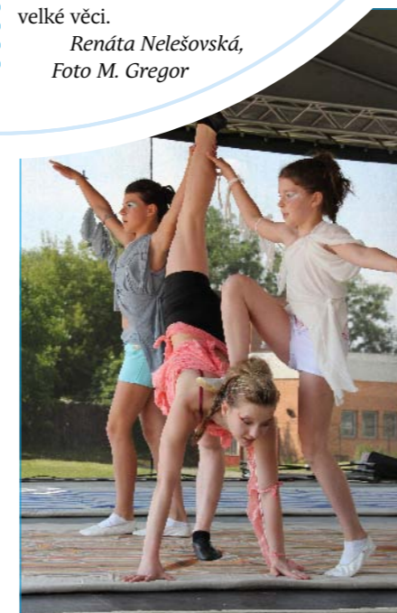
Cvičení Voltáže Tlumačov.