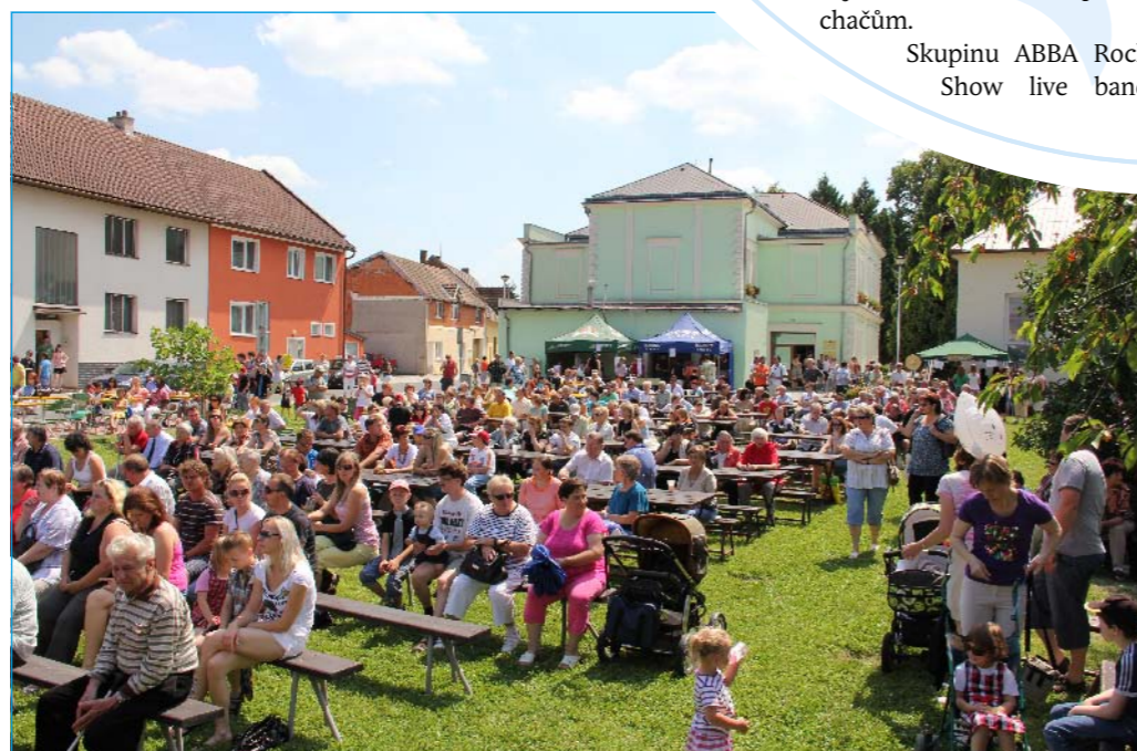
Oslava přilákala hodně občanů.