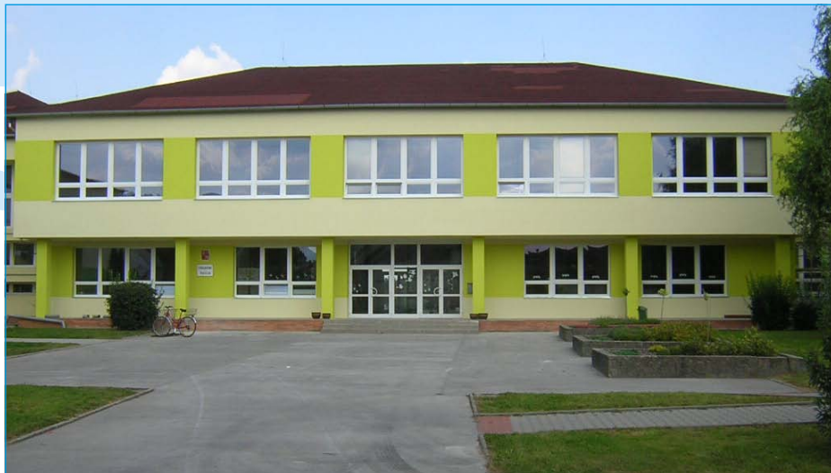
Základní škola v „novém kabátě“.

V tyto dny končí velká vodohospodářská akce „Odkanalizování obce Tlumačov