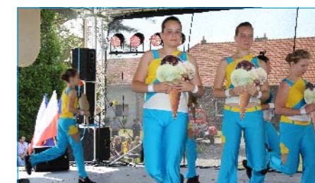
DDM Sluníčko - aerobic.