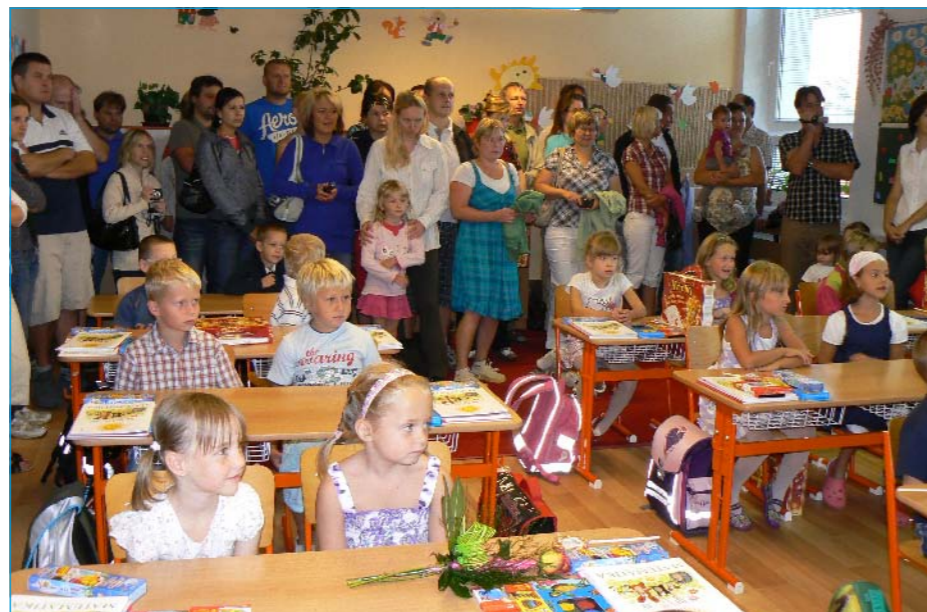
Prvněáci šk. roku 2011/2012.