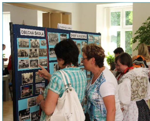
Výstava historie Tlumačova.