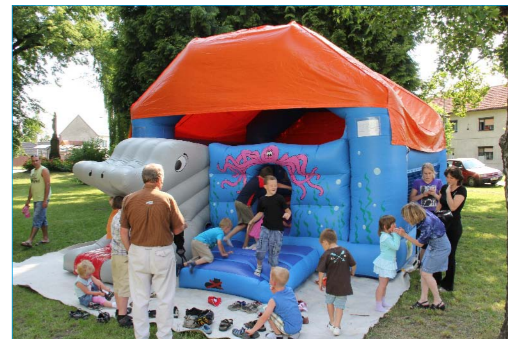
Dětský den při oslavách Tlumačova.