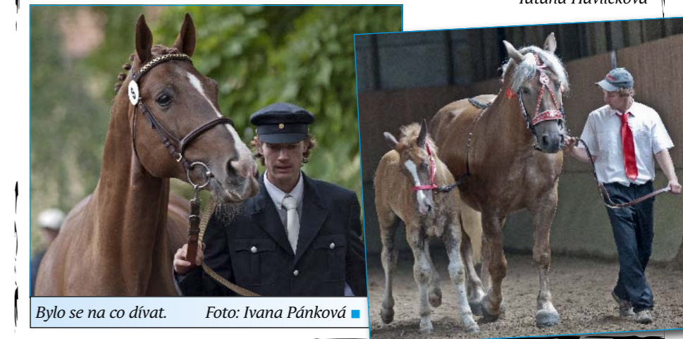
Bylo se na co dívat.