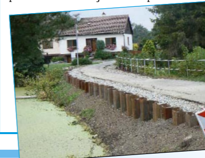
Oprava hráze

V současné době (září 2011) je prováděna v lokalitě U rybníčka stavba s názvem „Stabilizace hráze Tlumačov – pažení, ul. Kvasická“, která je prováděna jako oprava obecního majetku v rámci dotačního programu Obnova obecního a krajského majetku postiženého živelní nebo jinou pohromou – „Povodně 2010“, vypsáno v roce 2010 Ministerstvem pro místní rozvoj ČR. Rozpočto-