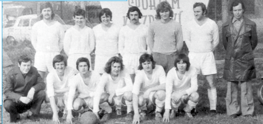
Tlumačovští fotbalisté z roku 1975.