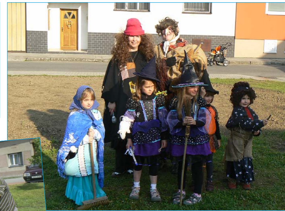
Čarodějnice v Tlumačově.

V páteční podvečer 29. dubna 2011 se uskutečnilo na náměstí Komenského stavění májky, tentokrát spojené i s pálením čarodějnic. Občané Tlumačova mohli sledovat, jak dorostenci z oddílu kopané a další schopní muži vztyčili 10 metrovou májku uprostřed náměstí. Rok od roku se hoši lepší a postavení májky se pro ně stává hračkou. Možná by si troufli i na vyšší. Letos jsme poprvé vyzvali i čarodějnice, aby si přišly zakřepčit u ohýnku. Přišly zástupkyně starší i mladé generace, ale upálit se nám podařilo jen jednu. Pak si na ohýnku mohl každý opět špekáček. Při kácení májky v neděli