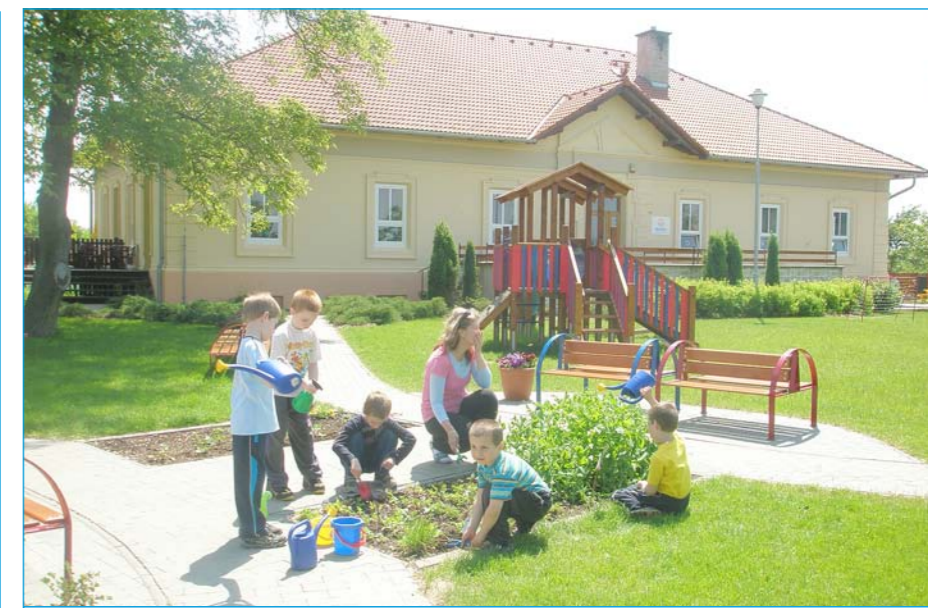
Děti na školní zahradě.

Intenzivní kontakt s přírodou zažívají děti při pěstitelských pracích. A užívají si to. Na záhon, kde jim odkvetly macešky, narcisy, tulipány a hyacinty, zaselí malí zahradníci ředkvičku, hrášek a mrkvičku a bedlivě sledují, jak rostou. Na další záhon vysadili sazenice jahod. Letos dostali ještě