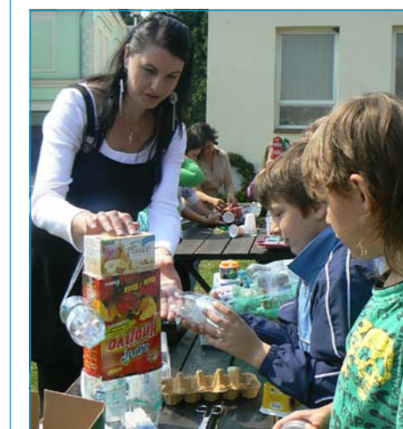
Žáci si vyzkoušeli i svou tvořivost.