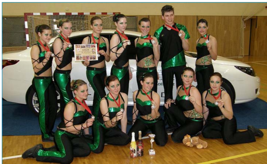
Aerobiková skupina Pavouci.

17. dubna 2011 se konala krajská přehlídka pohybových skladeb, kam jsme postoupili z Bystřice. Čertíci, Leopardi a Alenka v Říši divů skončili ve svých kategoriích na 2. místě Zmrzlináři na 3. místě