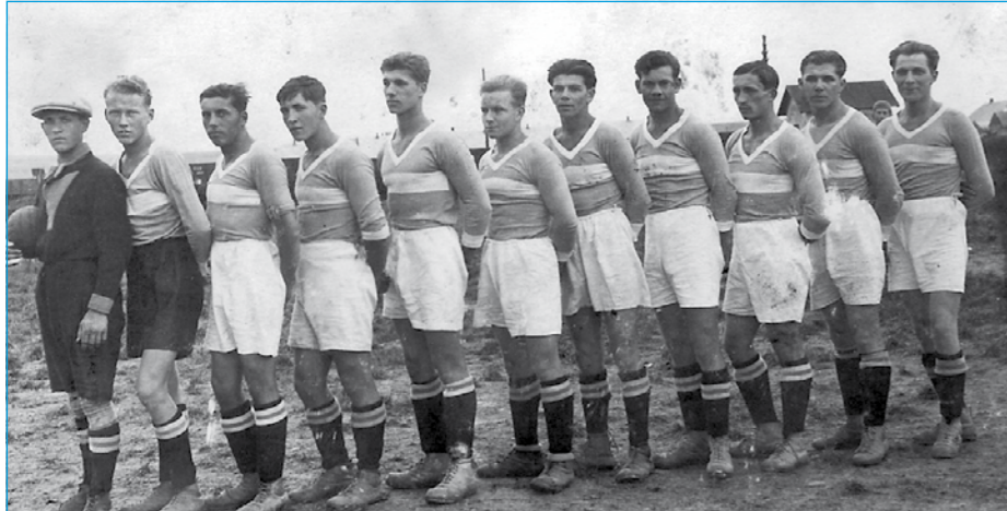
Nejstarší dochovaná fotografie tlumačovských fotbalistů.