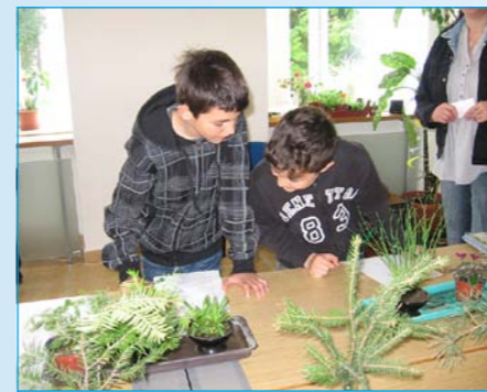
Žáci poznávají rostliny.

V letošním roce se do celostátní vědomostní soutěže Mladý zahradkář v Tlumačově přihlásilo okolo 47 dětí, proto jsme se rozhodli udělat místní kolo. Abychom dětem usnadnili přípravu na soutěž, tak jsme pro ně 11. dubna 2011 připravili výstavku zeleniny, ovoc-