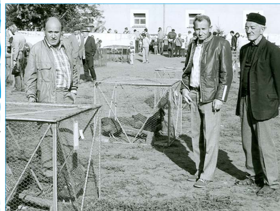
Tlumačovští chovatelé v minulých letech.