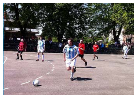
V zápalu boje o míč.