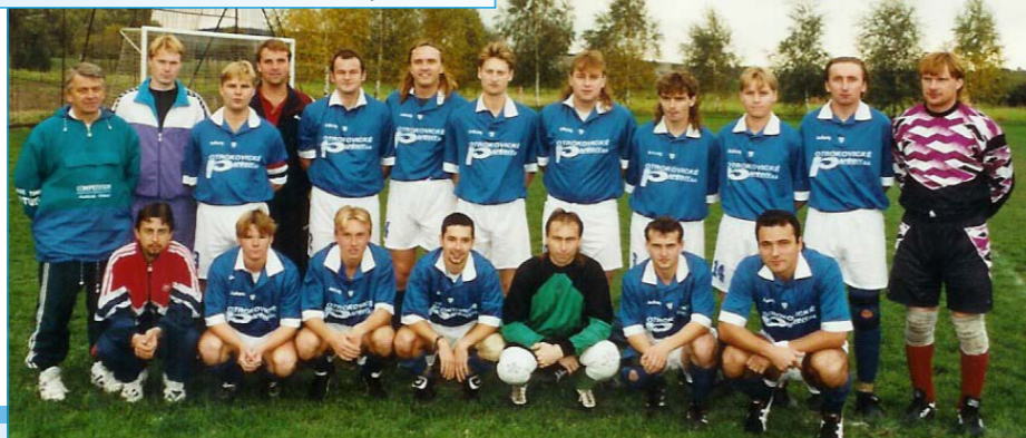
Tlumačovští fotbalisté z roku 1997.

Významný moment v historii oddílu přišel v roce 1946, kdy bylo ve spolupráci s obcí slavnostně otevřeno nové fotbalové hřiště na místě, kde se nachází doposud. Hřiště tehdy mělo škvárový povrch a členové oddílu při jeho stavbě odpracovali neuvěřitelných 1 300 hodin.