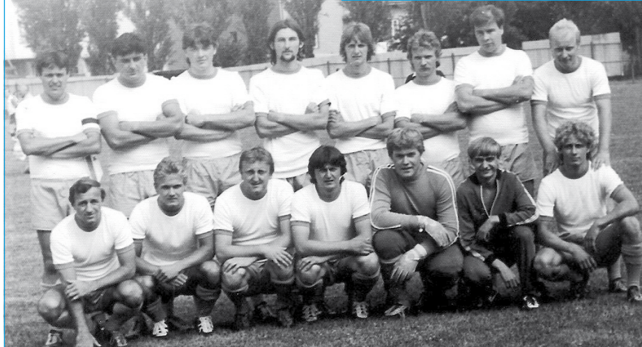
Tlumačovští fotbalisté z roku 1985.