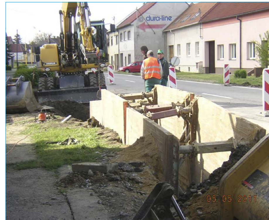
Odkanalizování obce v Masarykově ulici.