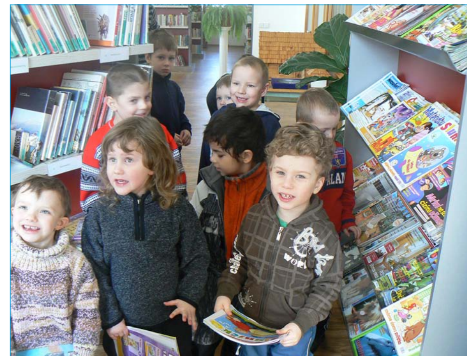
Děti z MŠ Klubičko v knihovně.