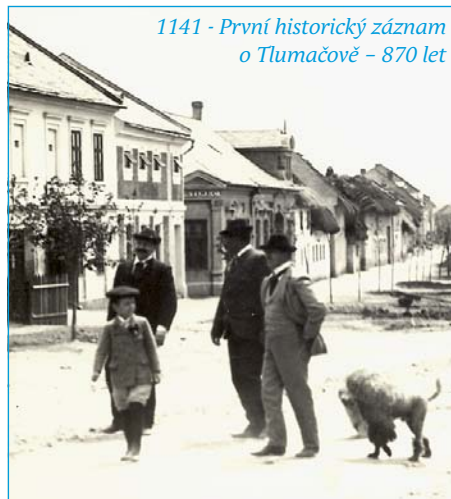
1141 - První historický záznam o Tlumačově – 870 let