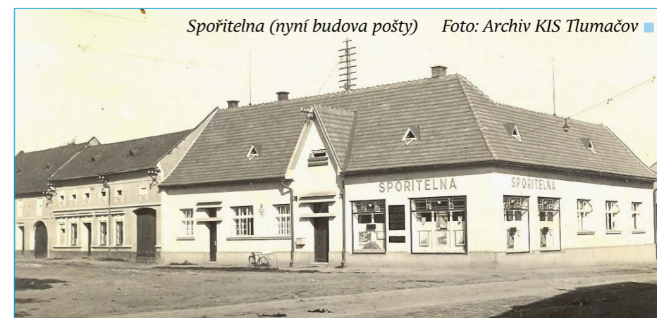
Spořitelna (nyní budova pošty)