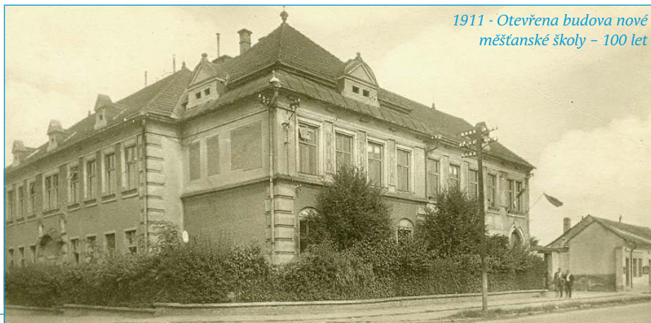
1911 - Otevřena budova nové měšťanské školy – 100 let