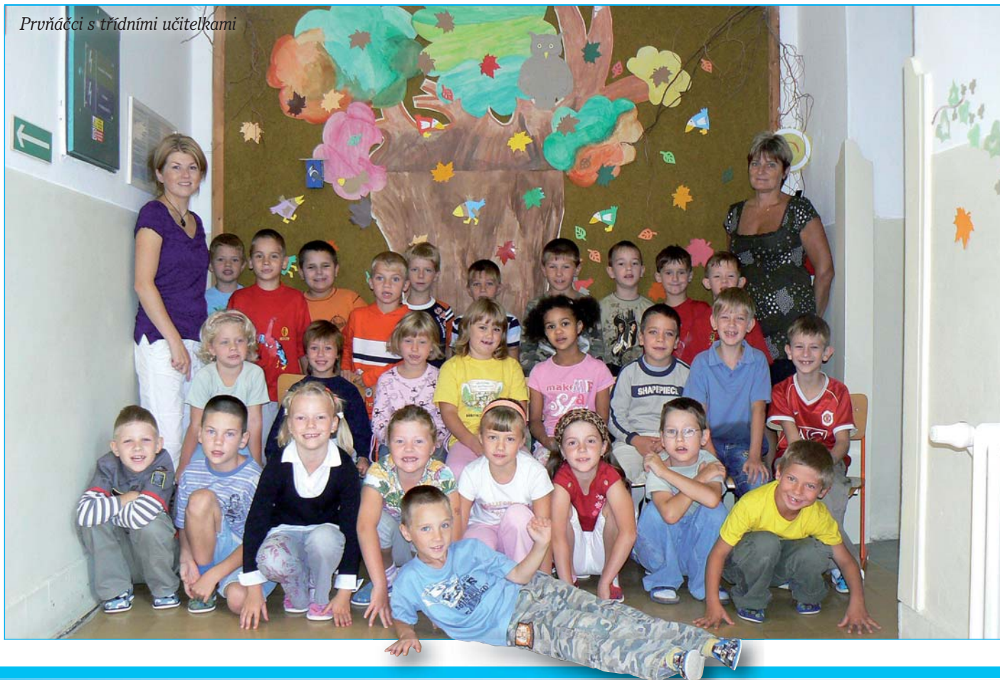
Prvníáci s třídními učitelkami

V souvislosti s platností nového stavebního zákona č.183/2006 Sb., ve znění pozdějších novel, se od 1. 1. 2007 přesu- (pokračování na straně 2)