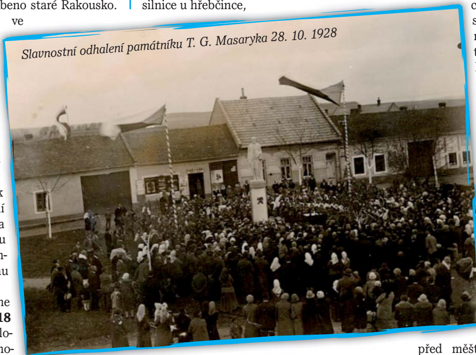
Slavnostní odhalení památníku T. G. Masaryka 28. 10. 1928