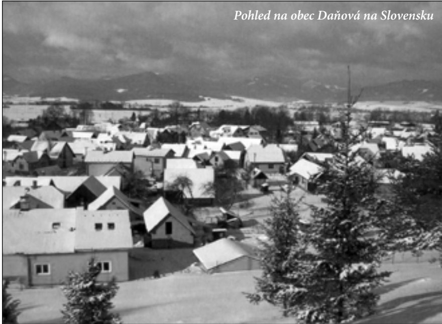
Pohled na obec Ďanová na Slovensku

vuje Dohoda o spolupráci v oblasti mládeže, sportu a kulturně-společenské činnosti mezi obcí Ďanová a obcí Tlumačov.