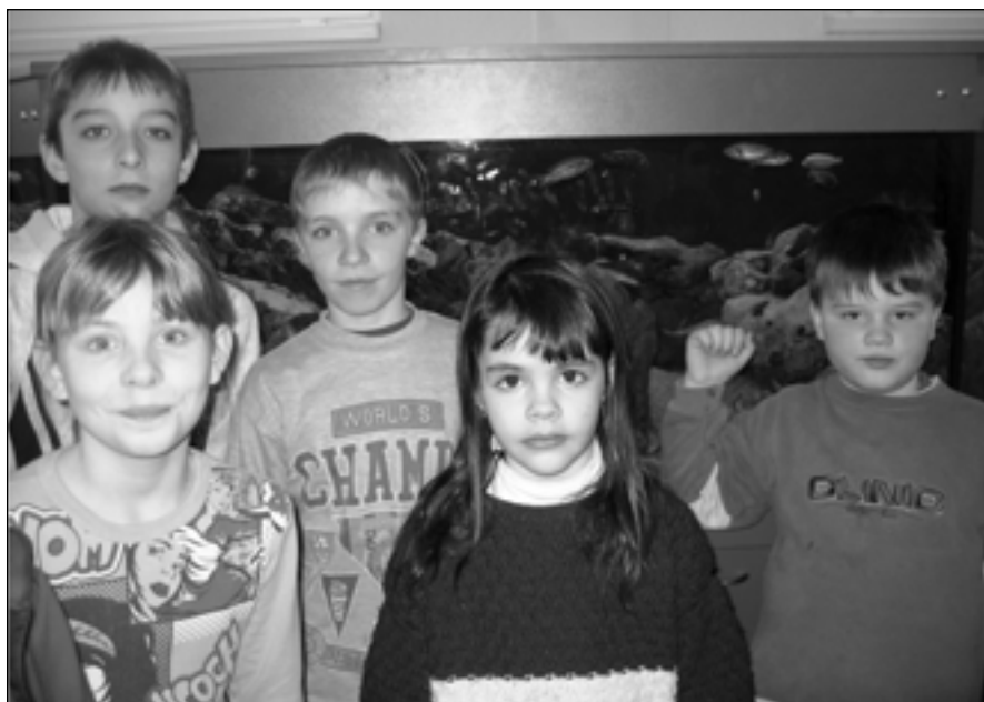
Návštěva Aguacentra Delfín v Uherském Brodě